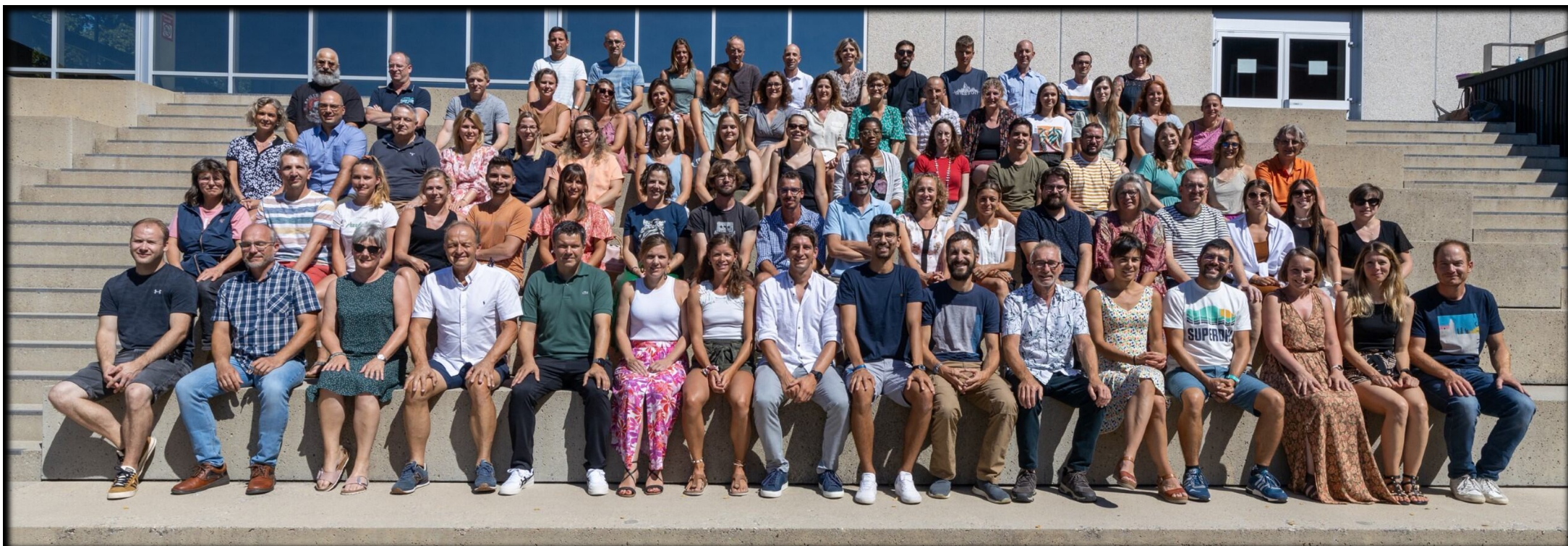
Les enseignants du COV